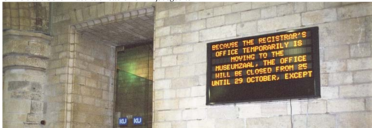
Universiteit Leuven – Dienst Studentenadministratie