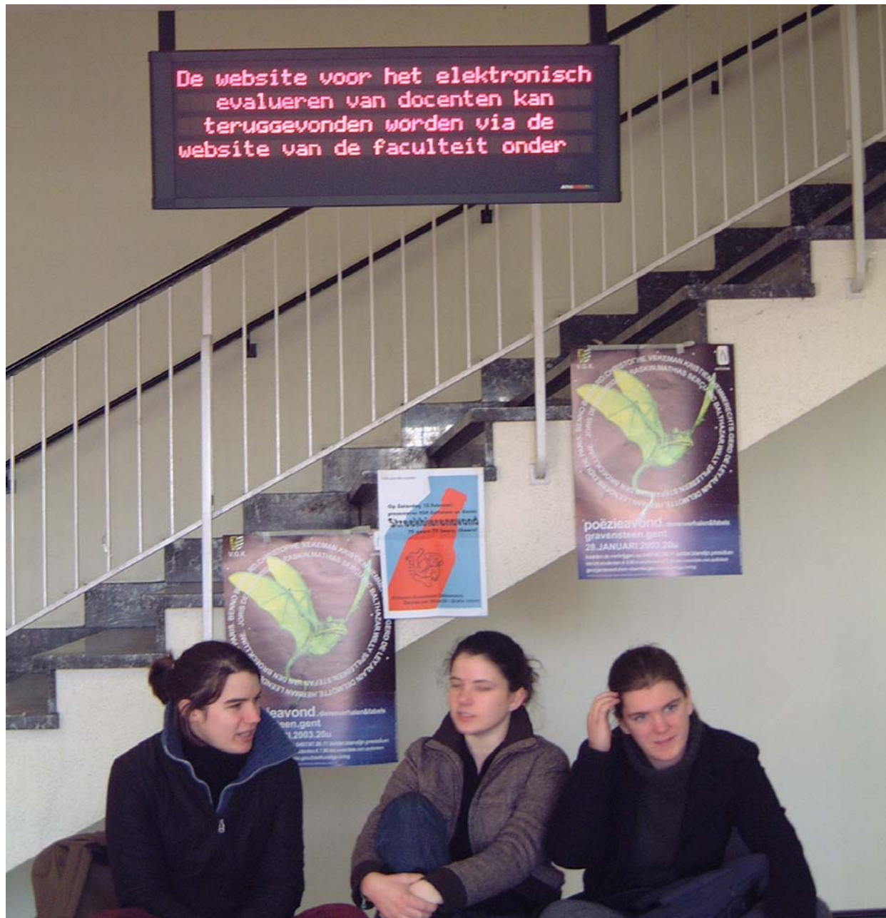
LICHTKRANTEN VOOR STUDENTENINFO