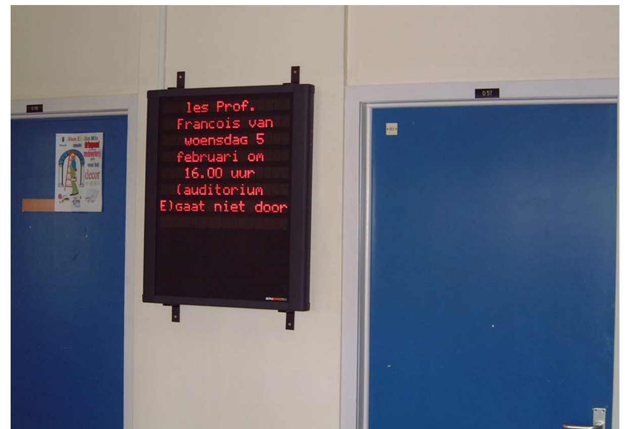
Universiteit Gent – Faculteit Letteren en Wijsbegeerte

op het decanaat en de dienst studentenadministratie van de faculteit.