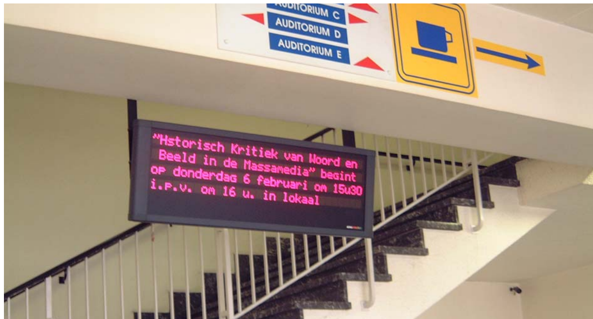
Universiteit Gent – Faculteit Letteren en Wijsbegeerte